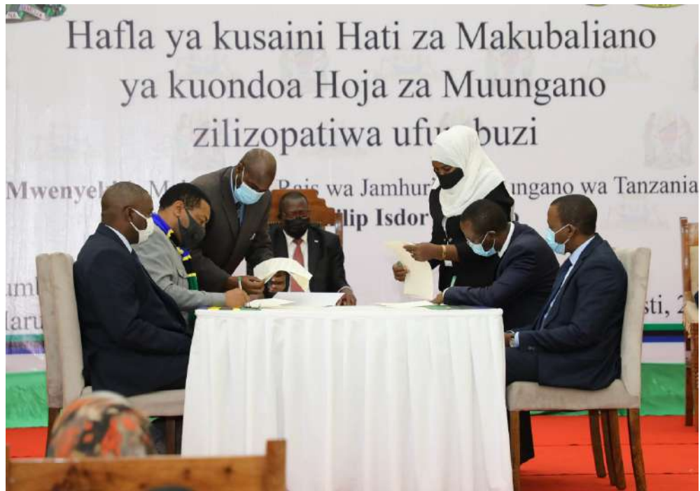
Makamu wa Rais wa Jamhuri ya Muungano wa Tanzania Dkt. Philip Isidor Mpango akishuhudia utiaji saini wa hati za makubaliano ya kuondoa hoja za Muungano zilizopatiwa ufumbuzi. Hafla iliofanyika katika Ukumbi wa Chuo cha Utalii, Maruhubi, Zanzibar Agosti 24, 2021.

22. Mheshimiwa Spika, Serikali zote mbili zina nia ya dhati na thabiti katika kuhakikisha kuwa, changamoto za Muungano zilizopo na zitakazojitokeza zinashughulikiwa kwa ushirikiano mkubwa kwa lengo la kuendelea kuenzi, kuulinda na kuudumisha Muungano wetu. Hivyo, wananchi waendeleo kuwa na imani na Serikali za pande mbili za Muungano kwamba changamoto zilizobakia na ambazo kimsingi zipo katika hatua mbalimbali za kupatiwa ufumbuzi zitakamilishwa. Aidha, makubaliano yaliyofikiwa na pande mbili kwa hoja zilizopatiwa ufumbuzi, yatatekelezwa kama ilivyokubalika.