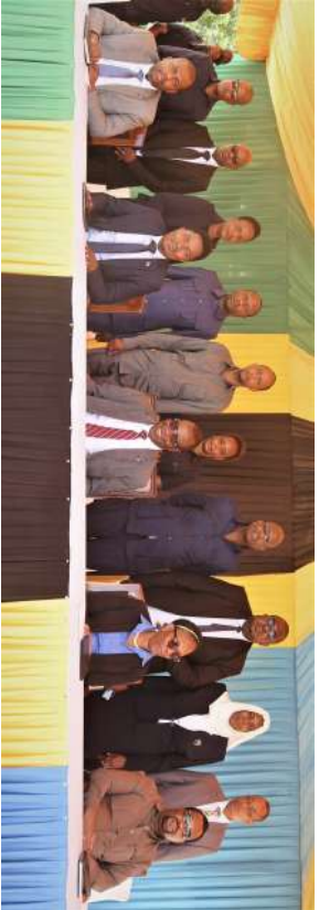
Makamu wa Rais wa Jamhuri ya Muungano wa Tanzania Mhe. Dkt. Philip Isidor Mpango akirua katika picha ya pamoja na viongozi na watumishi wa Ofisi yake alipokutana nao katika kikao kilichofanyika Mtumba jijini Dodoma Machi 23, 2022.