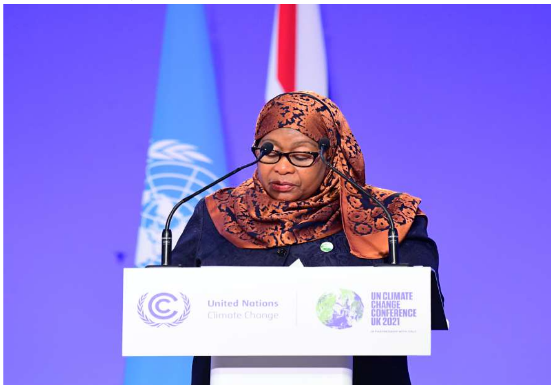
Rais wa Jamhuri ya Muungano wa Tanzania Mhe. Samia Suluhu Hassan akihutubia katika Mkutano wa 26 wa Nchi Wanachama wa Mkataba wa Umoja wa Mataifa kuhusu Mabadiliko ya Tabianchi COP26 uliofanyika katika Mji wa Glasgow, Scotland tarehe 02 Novemba, 2021.

wa Jamhuri ya Muungano wa Tanzania, Mhe. Samia Suluhu Hassan na ulishiriki katika Masuala muhimu yaliyojadiliwa katika mkutano huo ambayo ni pamoja na: Uhimili wa athari za mabadiliko ya tabianchi; Upatikanaji wa fedha kwa ajili ya kukabiliana na athari za mabadiliko ya tabianchi; Upatikanaji na uhawilishaji wa teknolojia; Kujenga uwezo katika kukabiliana na mabadiliko ya tabianchi; Utafiti na sayansi ya mabadiliko ya tabianchi; Upunguzaji wa gesi-joto; na Athari za sera za kukabiliana na mabadiliko ya tabianchi. Aidha, Tanzania iliwasilisha andiko la mchango wa nchi katika kukabiliana na mabadiliko ya tabianchi ( Nationally Determined Contribution ).