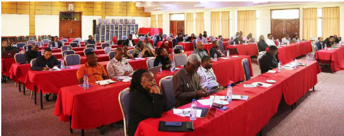
Wadau mbalimbali wa mazingira kutoka Mkoa wa Dodoma wakimsikiliza Waziri wa Nchi Ofisi ya Makamu wa Rais (Muungano na Mazingira), Dkt. Mhe. Selemani Jafo baada ya kukutana nao Januari 26, 2022, Dodoma.

utekelezaji wa Sheria ya Usimamizi wa Mazingira. Maafisa mazingira 40 wamejengewa uwezo katika masuala ya udhibiti na usimamizi wa taka ngumu na taka hatarishi; elimu kuhusu matumizi sahihi ya Zebaki katika shughuli za uchimbaji mdogo wa dhahabu; matumizi ya nishati mbadala; mabadiliko ya tabianchi; Tathmini ya Athari kwa Mazingira (TAM); na Tathmini ya Mazingira Kimkakati (TMK).