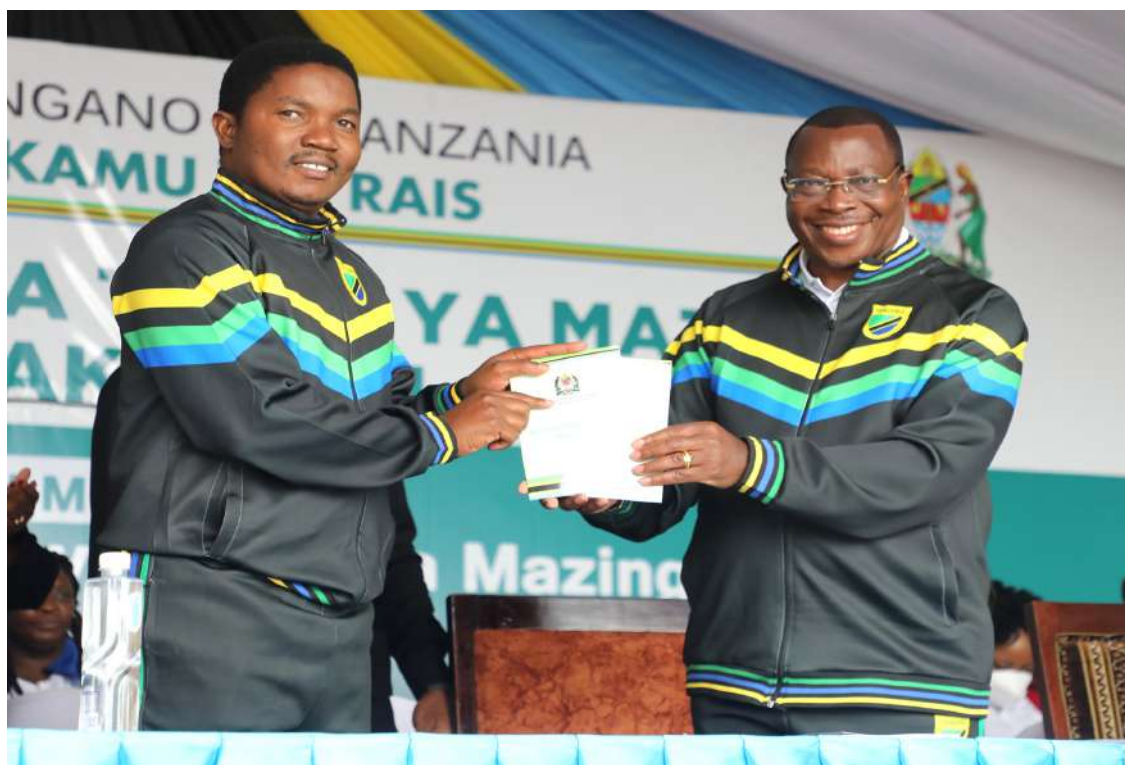
Makamu wa Rais wa Jamhuri ya Muungano wa Tanzania Mhe. Dkt. Philip Isdor Mpango akizindua Sera ya Taifa ya Mazingira ya Mwaka 2021. Kushoto ni Waziri wa Nchi Ofisi ya Makamu wa Rais (Muungano na Mazingira) Mhe. Dkt. Selemani Jafo. Uzinduzi ulifanyika Februari 12, 2022.