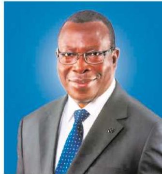
Mhe. Dkt. PHILIP ISDOR MPANGO Makamu wa Rais wa Jamhuri ya Muungano wa Tanzania