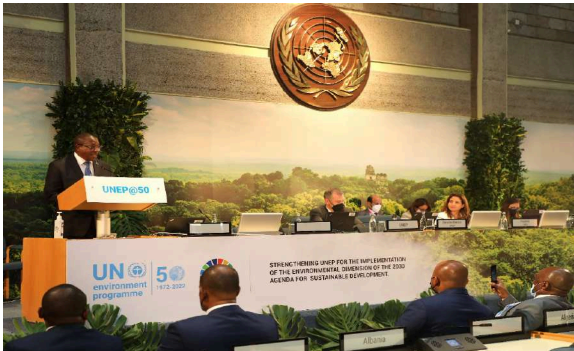
Makamu wa Rais wa Jamhuri ya Muungano wa Tanzania Mhe. Dkt. Philip Isdor Mpango akitoa salamu za Tanzania kwa niaba ya Mhe. Rais Samia Suluhu Hassan katika Mkutano maalum wa miaka 50 ya Shirika la Umoja wa Mataifa la Mazingira (UNEP) uliofanyika Machi 3, 2022 jijini Nairobi, Kenya.