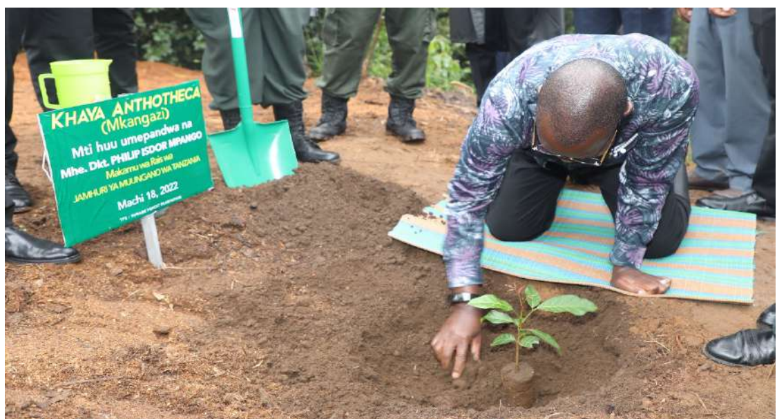
Makamu wa Rais wa Jamhuri ya Muungano wa Tanzania Mhe. Dkt. Philip Isdor Mpango akipanda mti katika shamba la miti lililopo katika msitu wa Rubare wilayani Bukoba mkoani Kagera wakati alipotembelea na kukagua mistu huo Machi 18, 2022.