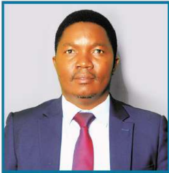
Mhe. Dkt. SELEMANI SAIDI JAFO Waziri wa Nchi Ofisi ya Makamu wa Rais (Muungano na Mazingira)